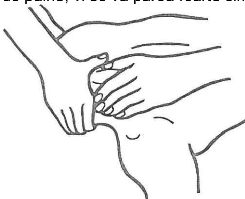
Strângerea părții de sus a umerilor

5. Pentru a elibera tensiunea din umeri, lucrați asupra acestora alternativ, ridicând și strângând ușor mușchii tensionații. Această mișcare este denumită „strângere” și, dacă sunteți pricepuți la făcut aluatul de pâine, vi se va părea foarte simplă.