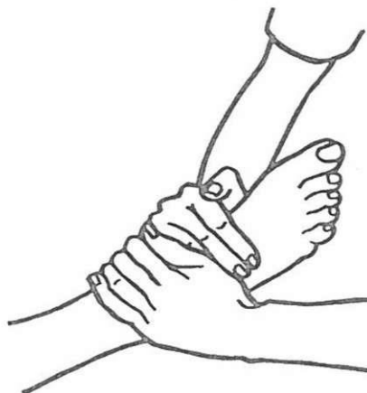
Masarea fermă a labei piciorului