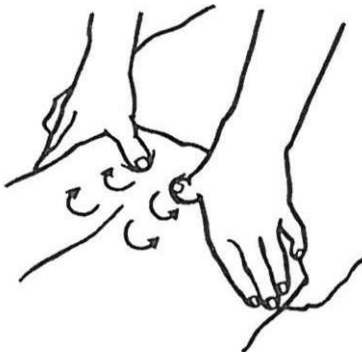
Fricționarea spatelui pornind de la baza coloanei către ceafă

2. Începând de la baza coloanei vertebrale, faceți cu degetele mari mișcări circulare, mici, până când ajungeți la ceafă (mișcări prin fricțiune). Nu apăsați direct pe șira spinării. Apoi repetați aceste mișcări în jurul fiecărui umăr, pentru a îndepărta nodulii și ganglionii.